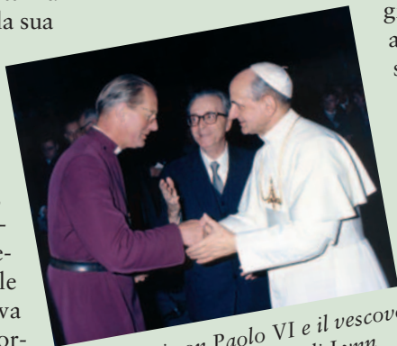
I. Giordani con Paolo VI e il vescovo anglicano W.S. Llewellyn di Lynn

“Q uale contributo ha dato all'ecumenismo!!! Lui lo ha già fatto. Ecumenismo non significa che tu abbandoni la tua fede: significa che la scopri come realtà che ti può unire agli altri. Io sono un battista e lui cattolico, e ci amavamo. Parlavamo e io leggevo i suoi scritti: aveva uno stile aggressivo, a volte settario che si poteva