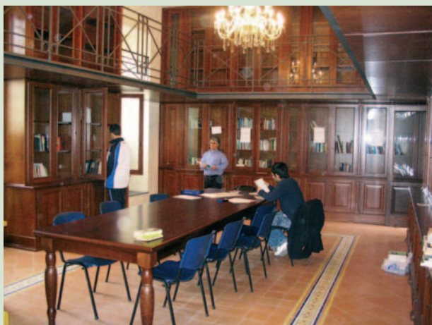
Biblioteca I. Giordani di Nocera Inferiore

Adesso, ci raccontano i nostri, c’è il duro lavoro del trasferimento dei volumi per la costruzione dell’archivio bibliotecario. Al tempo stesso, stanno arrivando notizie incoraggianti sul fronte dei contributi: il Presidente della Provincia di Salerno ha disposto un finanziamento in favore della Diocesi – per lo sviluppo della Biblioteca I. Giordani – di € 15.000. Il Vescovo, aggiornato delle varie realtà nascenti, fra le quali la rete mondiale delle Associazioni I. Giordani, auspica che quello nocerino possa essere, al pari degli altri, un luogo di irradiazione di una nuova cultura tramite la figura di Foco.